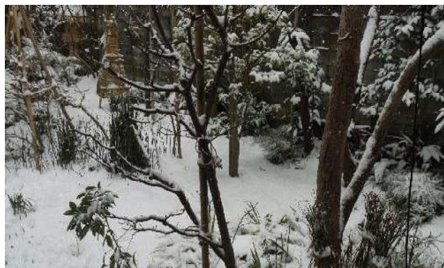
2月10日(日) かなりの積雪

電圧が低下して灯りがユラユラしたり暗くなったりすることもほとんどない。灯り位なら問題ないが、精密機械なら電圧や周波数の変動は致命的であり、しっかり「しわ取り」した良質の電力は先進国においては必須と言える。