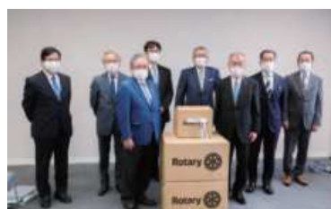
金沢8RCの代表とともに記念撮影