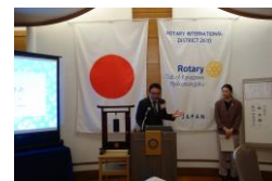
島田カウンセラーより紹介