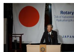
仲島会員からご紹介

昭和37(1962)年生まれ。(株)日本ソフトバンク(現ソフトバンク(株))を経て 平成7(1995)年5月より金沢市議会議員 平成22(2010)年12月より金沢市長 令和4(2022)年2月金沢市長退任 同3月石川県知事選挙落選 令和4(2022)年9月金沢大学客員教授就任 同10月よりソフトバンク戦略顧問就任