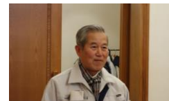
仲島会員からのご紹介

〔ご略歴〕 金沢生まれ 金沢東山育ち 金沢市内を中心に能登・金沢・加賀の民話を語り部として伝承中 篠笛や洋楽とのコラボレーションも企画